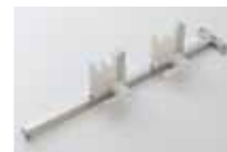
内視鏡保持ホルダー

お客様のご要望に応じて オーダーメイドの 内視鏡システムシンク を製作しております。