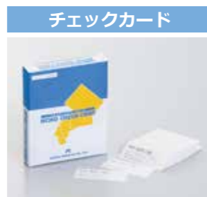
●入数/1ケース100枚 ●カードサイズ/20mm×50mm