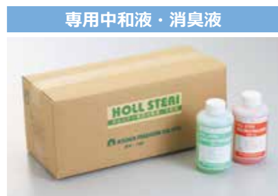
●中和液(赤) 入数/500cc×5本 ●消臭液(緑) 入数/500cc×5本